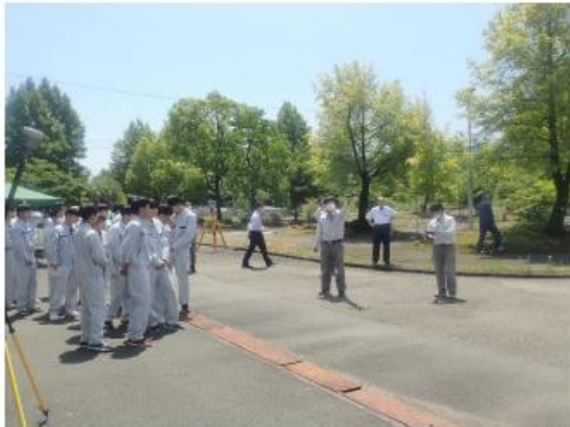
小型 UAV の飛行