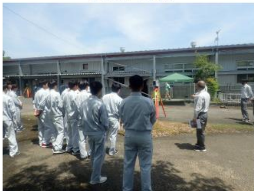
地上レーザスキャナを使用した3次元計測

次に4班に分かれてGNSS測量機を用いたネットワーク型RTK（単点観測）法による地形の観測及び、電子平板による平面図の作成を体験していただきました。