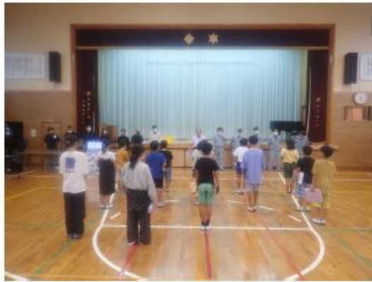
指導員14名と4,5,6年生(14名)

測量実習は、4,5,6年生(14名)を対象に伊能忠敬により用いられた測量方法『歩測』を体験していただきました。指導員は、当協会の14名(宮崎測量設計コンサルタント7名と第一コンサルタント7名)が努めました。