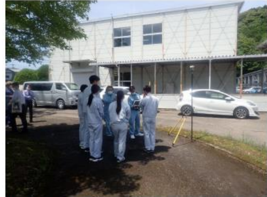
GNSS 測量機と電子平板による3次元座標の観測

実地講習後、最新の測量技術について紹介しました。UAV搭載型レーザスキャナでは、植生下でも旧農地の地形が計測出来ている事例を紹介し、自動追尾TSでは、ミラーの動きに合わせて自動で視準する機器を体験していただきました。