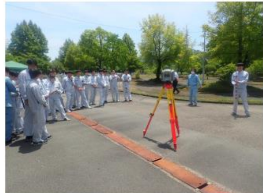
UAV レーザ測量機器や自動追尾 TS の展示・説明