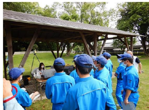
UAVレーザ測量機器や自動追尾TSの展示・説明