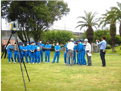
地上レーザスキャナを使用した3次元計測

次に4班に分かれてGNSS測量機を用いたネットワーク型RTK（単点観測）法による地形の観測及び、電子平板による平面図の作成を体験していただきました。