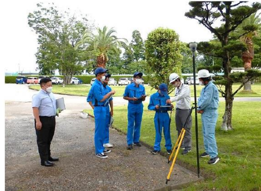
GNSS測量機と電子平板による3次元座標の観測

実地講習後、最新の測量技術について紹介しました。UAV搭載型レーザスキャナでは、植生下でも旧農地の地形が計測出来ている事例を紹介し、自動追尾TSでは、ミラーの動きに合わせて自動で視準する機器を体験していただきました。