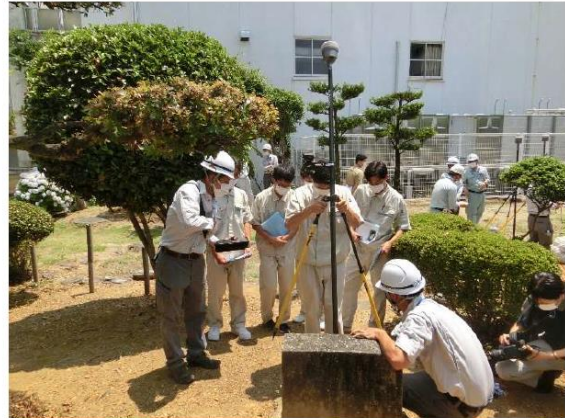
既設基準点の観測状況

次に、実際にモバイル3Dスキャナで計測した校内の3次元データを見学していただきました。