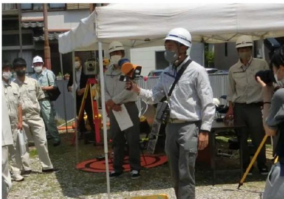
モバイル3Dスキャナの計測状況

次に5人1組の8班に分かれてGNSS測量機を使用し、ネットワーク型RTK(単点観測法)により、中庭の既設基準点を観測し座標差を確認しました。また、テニスコートの枠線を観測し、電子平板上の背景地図と計測位置が合っているか確認を行いました。