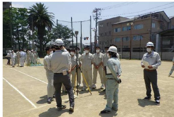
テニスコートの観測状況